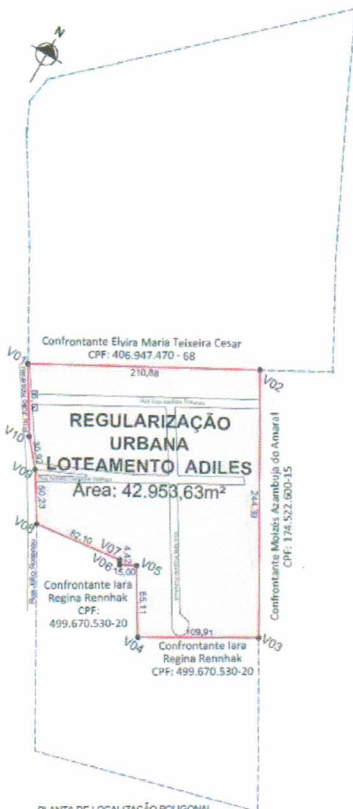
PLANTA DE LOCALIZAÇÃO POLIGONAL DE REURB GEORREFERENCIADA Escala 1/3000 - Polígono de REURB: 42.953,63m² - Área Remanescente 01 da Matrícula 1.967 - Área: 82.581,69m² - Área Remanescente 02 da Matrícula 1.967 - Área: 54.464,65m²

de 30 de maio de 1996, FLS.4, Livro nº 02 – Registro Geral, do Registro de Imóveis da Comarca de Barra do Ribeiro, assim como abertura de matrículas em nome do município dos logradouros e áreas públicas. CERTIFICA ainda, o cumprimento dos requisitos previstos na Lei Federal 13.465/17 para fins de Titulação dos respectivos beneficiários. Será conferida a outorga da Legitimação Fundiária (13.465, SESSÃO III, art.23). Uma vez observados os requisitos legais, na tabela abaixo, seguem as indicações numéricas das unidades/lote regularizados , bem como a lista de seus respectivos legitimados de acordo com os preceitos da lei 13.465/2017, conforme segue: